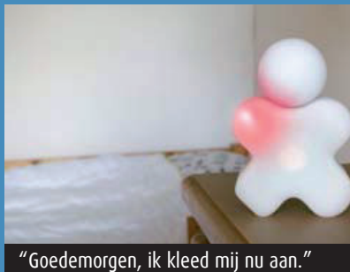
"Goedemorgen, ik kleed mij nu aan."