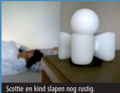
Scottie en kind slapen nog rustig.