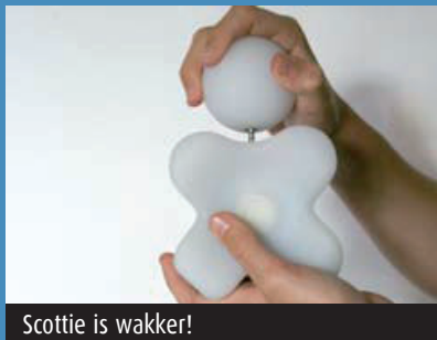
Scottie is wakker!