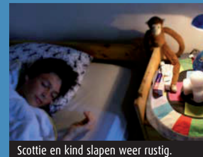
Scottie en kind slapen weer rustig.