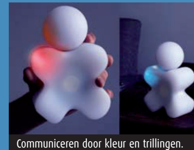
Communiceren door kleur en trillingen.