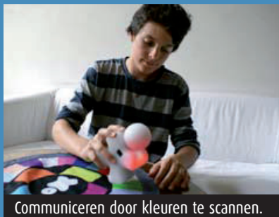
Communiceren door kleuren te scannen.