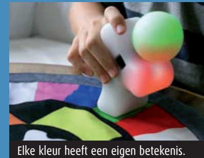
Elke kleur heeft een eigen betekenis.